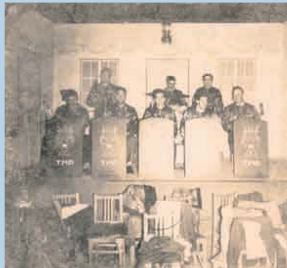
Tuna Musical da SRP (1935)

SRP tem sabido honrar os compromissos assumidos pelos seus fundadores, sendo hoje uma colectividade de referência (...), não só pelo modelo de gestão transparente como também pelo nível das suas instalações.