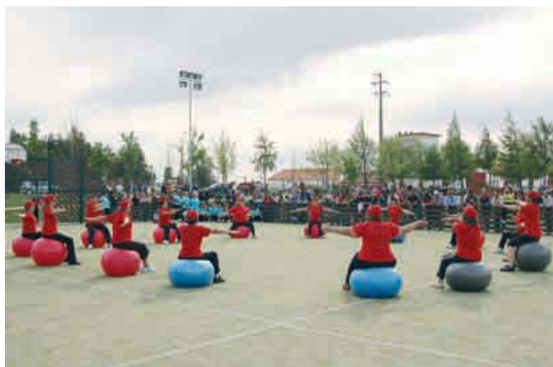
Actuação do Grupo de Ginástica da SRP, durante as Festas do Concelho de Constância

À Sociedade Recreativa Portelense a Câmara Municipal de Constância reitera os seus sinceros parabéns, relevando o trabalho que tem realizado em prol do associativismo e consequentemente do desenvolvimento do concelho.