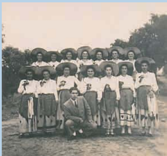
Grupo de música, danças e cantares da SRP (1940)