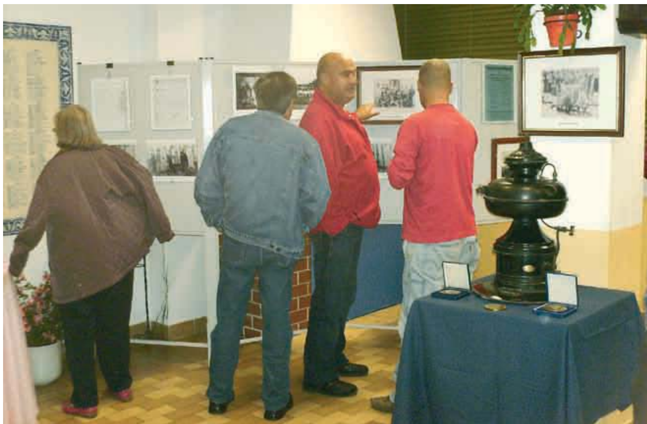
Exposição alusiva aos 75 anos da SRP