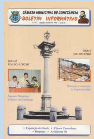
No 52 - JUL/AGO 1998

A contestação à Lei das Finanças Locais, cujos critérios os pequenos municípios consideravam altamente penalizadores dos seus interesses e, consequentemente, do seu desenvolvimento, fez reunir em Constância, em Julho de 1998, 40 municípios de pequena dimensão, apoiados por mais 30 de todo o país que enviaram textos de apoio e solidariedade.