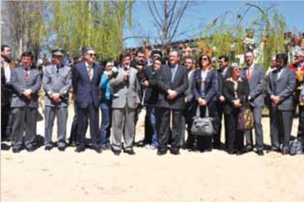
Secretário de Estado da Cultura presidiu às Cerimónias do Dia do Concelho