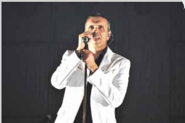
GNR no concerto de encerramento