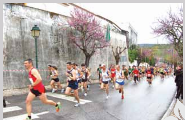
Mais de 1000 atletas no Grande Prémio da Páscoa