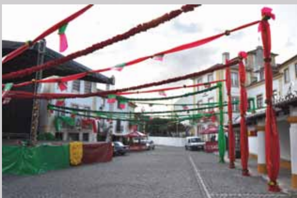
O Centenário da República foi o tema da decoração da Praça Alexandre Herculano

As imagens que agora publicamos são apenas uma pincelada na bonita tela que são a Festa de Nossa Senhora da Boa Viagem / Festas do Concelho de Constância.