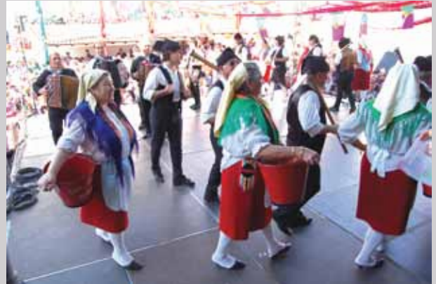
Danças e cantares tradicionais na Tarde de Folclore