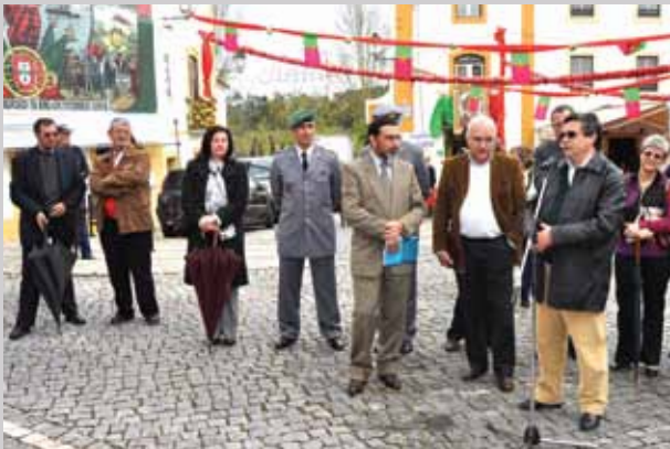
Cultura Avieira e apresentação da obra A Reconstrução do Sagrado: religiosidade popular nos Avieiros da Borda-d'Água