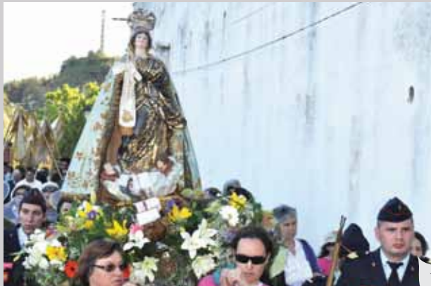
Nossa Senhora da Boa Viagem percorreu as ruas da vila em procissão