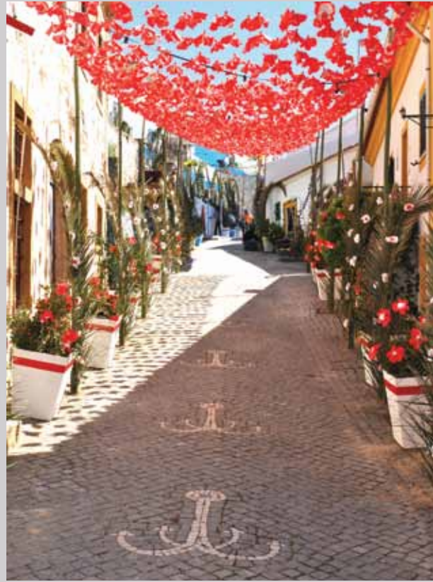
Ruas floridas, sempre um motivo de interesse