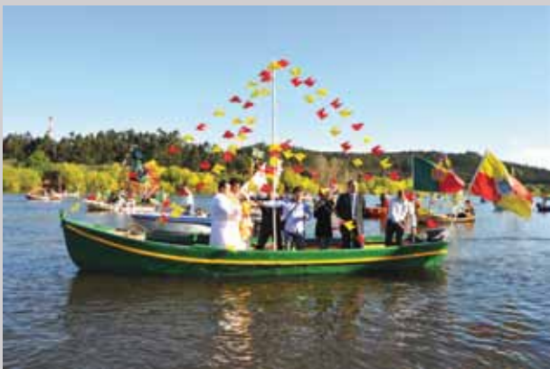
A Bênção dos Barcos dada do próprio Tejo