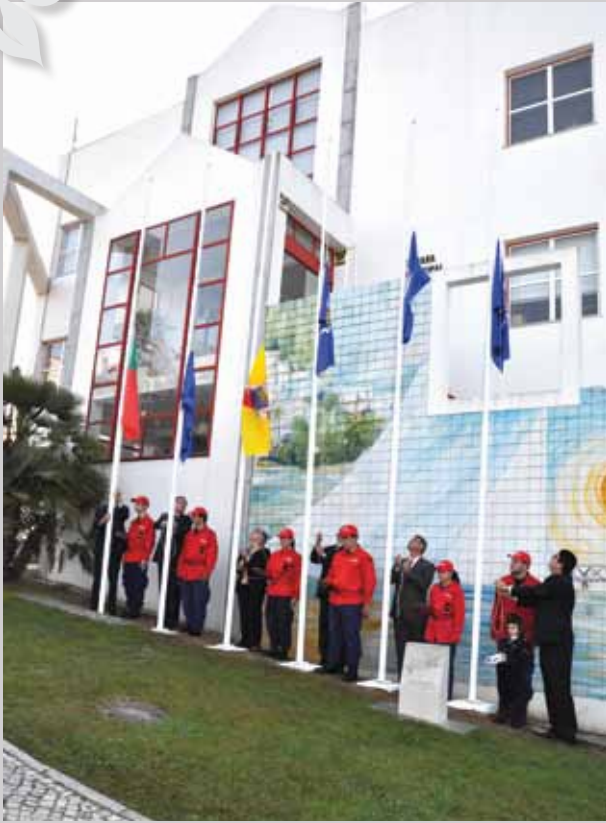
Pela primeira vez as bandeiras das freguesias também foram hasteadas nos Paços do Concelho