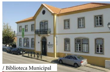
/ Biblioteca Municipal