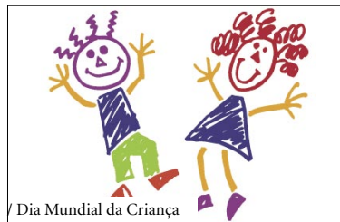
/ Dia Mundial da Criança