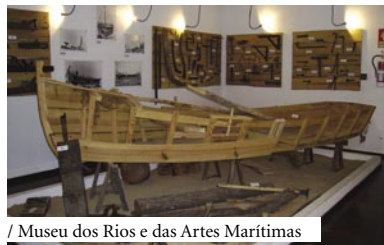
/ Museu dos Rios e das Artes Marítimas