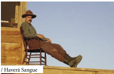
/ Haverá Sangue