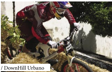
/ DownHill Urbano