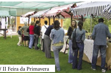
/ II Feira da Primavera