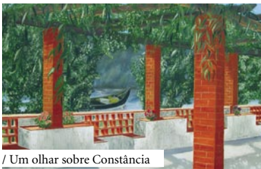
/ Um olhar sobre Constância