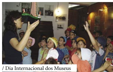
/ Dia Internacional dos Museus

O Dia Internacional dos Museus será assinalado com uma dramatização designada “Vidas Marítimas”, realizada pelos alunos da escola E.B. 2,3/S Luís de Camões, onde se apresentarão, através de uma história imaginária, as mais importantes actividades fluviais representadas no Museu. O objectivo desta iniciativa é mostrar outra forma de abordar a exposição permanente que está patente no Museu dos Rios e das Artes Marítimas.