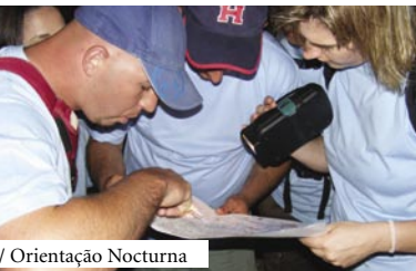
/ Orientação Nocturna

Actividade de índole competitivo onde o espectáculo desportivo se associa à paisagem do tecido urbanístico, originando momentos de rara beleza. Caracteriza-se pela descida de declives acentuados sobre uma bicicleta, a uma velocidade próxima da máxima, aproveitando as ruas, becos e escadas como obstáculos a ultrapassar na sua ânsia de alcançar velozmente a linha de meta e onde a adrenalina é uma constante. Nota: Actividade dinamizada em parceria com DHUnlimited.