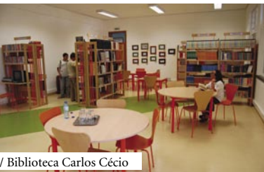
/ Biblioteca Carlos Cécio