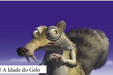
/ A Idade do Gelo