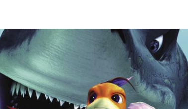
/ O Gang do Pi

O Auditório do Cine-Teatro Municipal encerrará no mês de Janeiro para obras de beneficiação.