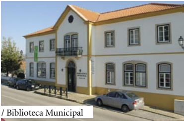
/ Biblioteca Municipal

ACTIVIDADES REGULARES Biblioteca Municipal Alexandre O’Neill