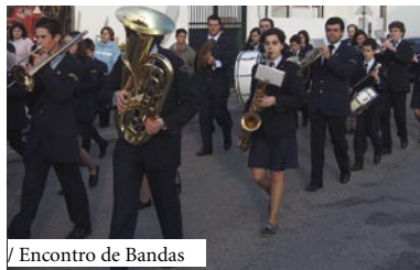
/ Encontro de Bandas