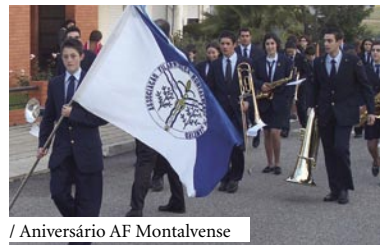
/ Aniversário AF Montalvense