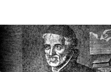
/ Padre António Vieira

No ano em que se comemora o quarto centenário do nascimento do Padre António Vieira, a Biblioteca Municipal Alexandre O’Neill procurará evidenciar os aspectos mais marcantes da vida de um dos mais destacados e rememorados escritores, pensadores e oradores de todos os tempos. Os seus inúmeros textos argumentativos e discursivos continuam a marcar a contemporaneidade e a enriquecer a língua portuguesa.