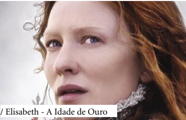
/ Elisabeth - A Idade de Ouro

HORA DE PONTA 3 [M/12] 90 min. 2 de Fevereiro | 21h30