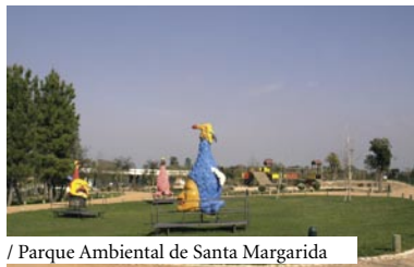
/ Parque Ambiental de Santa Margarida