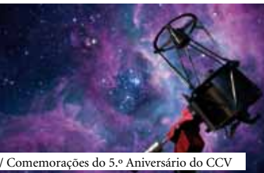
/ Comemorações do 5.º Aniversário do CCV