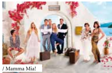
/ Mamma Mia!