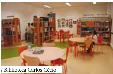
/ Biblioteca Carlos Cécio