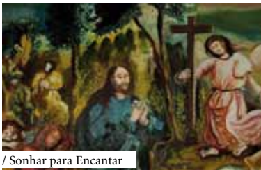
/ Sonhar para Encantar