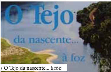
/ O Tejo da nascente... à foz