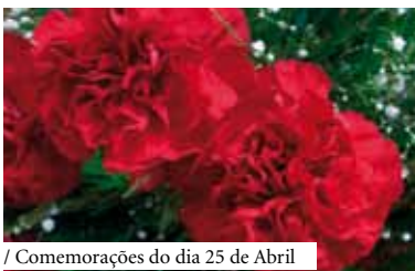
/ Comemorações do dia 25 de Abril

Organização: Junta de Freguesia de Santa Margarida da Coutada