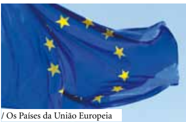
/ Os Países da União Europeia

Organização: Escola Luís de Camões (Biblioteca Carlos Cécio/Esplanada de Leitura António Câmara)