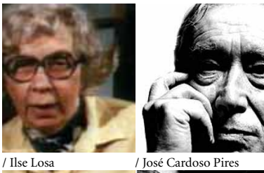
/ Ilse Losa