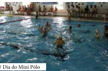
/ Dia do Mini Pólo