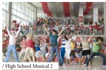
/ High School Musical 2

Pretende-se valorizar o fundo audiovisual da Biblioteca, com a exibição sistemática de filmes ou documentários alusivos a temáticas com pertinência temporal e de interesse geral ou local.