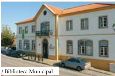
/ Biblioteca Municipal