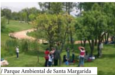
/ Parque Ambiental de Santa Margarida