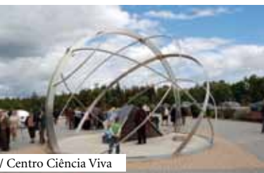
/ Centro Ciência Viva

Centro Ciência Viva de Constância 4 de Abril | 10h00 › 22h00