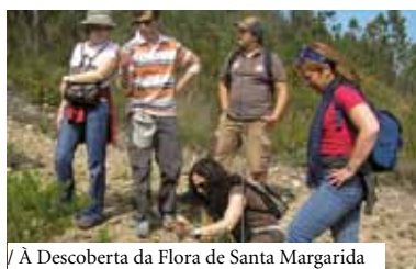
/ À Descoberta da Flora de Santa Margarida

Ponto de Encontro: Posto de Turismo 7 de Junho | 09h00