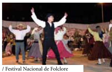
/ Festival Nacional de Folclore

Organização: Rancho Folclórico “Os Camponeses” de Malpique Apoio: Câmara Municipal de Constância