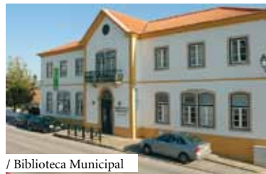
/ Biblioteca Municipal