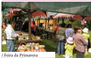
/ Feira da Primavera