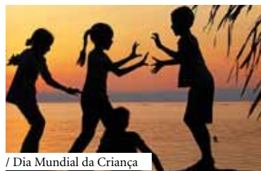
/ Dia Mundial da Criança

Com esta iniciativa, pretende-se sensibilizar as crianças para a importância dos livros e da leitura no seu desenvolvimento e ao mesmo tempo valorizar e divulgar a qualidade da literatura infantil portuguesa.