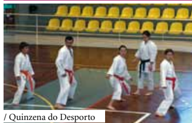
/ Quinzena do Desporto