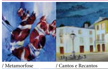
/ Metamorfose / Cantos e Recantos