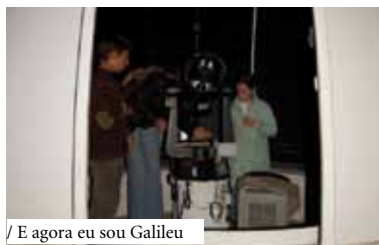
/ E agora eu sou Galileu

Observação dos anéis de Saturno através de telescópios.