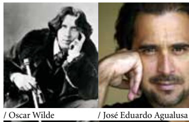
/ Oscar Wilde