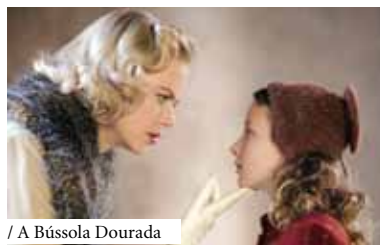
/ A Bússola Dourada

Pretende-se valorizar o fundo audiovisual da Biblioteca, com a exibição sistemática de filmes ou documentários alusivos a temáticas com pertinência temporal e de interesse geral ou local.