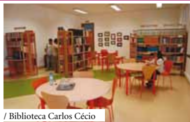
/ Biblioteca Carlos Cécio