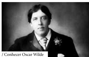
/ Conhecer Oscar Wilde

Organização: Escola Luis de Camões (Biblioteca Carlos Cécio e Esplanada de Leitura António Câmara)