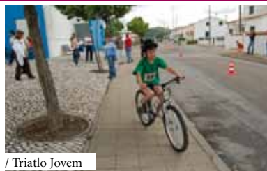
/ Triatlo Jovem