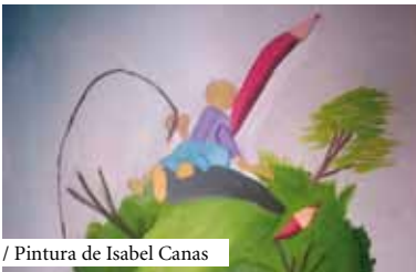
/ Pintura de Isabel Canas

“Com o óleo exprimi: mitologia, sentimentos, sonhos e história, com os pincéis sobre a tela dei-lhe: cor, luz arte e forma”.