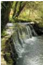
Capa: Açude da Ribeira da Foz

EVENTUAIS ALTERAÇÕES NA PROGRAMAÇÃO CONSTANTE NESTA AGENDA SÃO DA RESPONSABILIDADE DOS ORGANIZADORES DAS INICIATIVAS