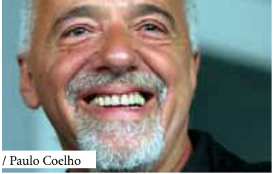
/ Paulo Coelho