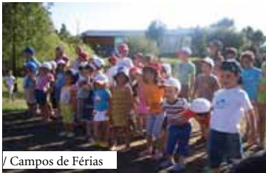
/ Campos de Férias