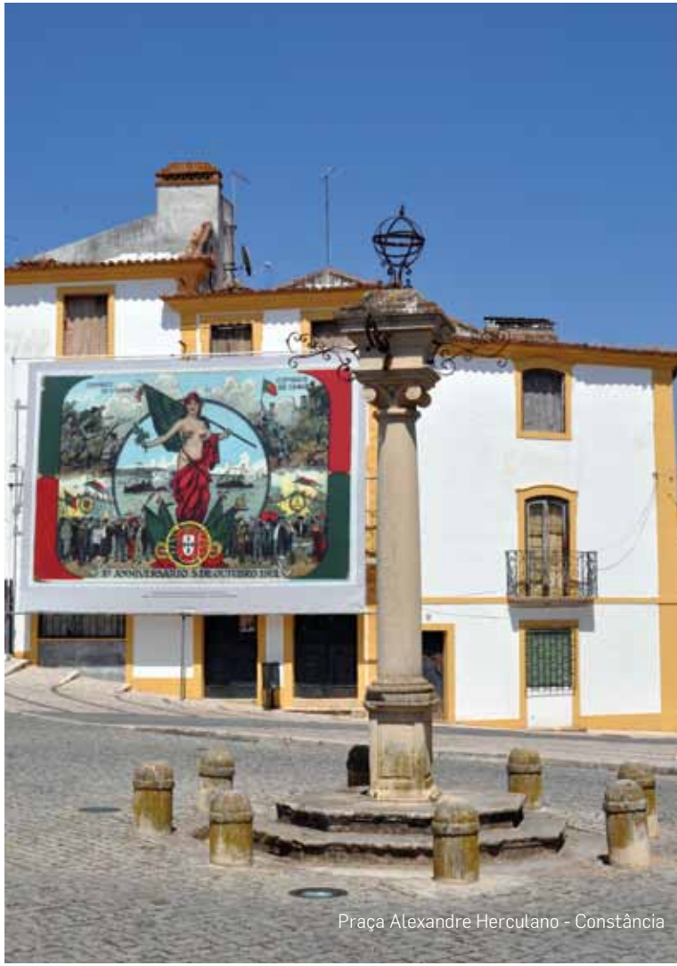
Praça Alexandre Herculano - Constância