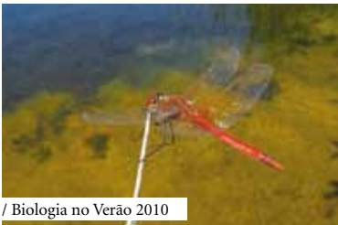
/ Biologia no Verão 2010