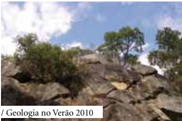
/ Geologia no Verão 2010