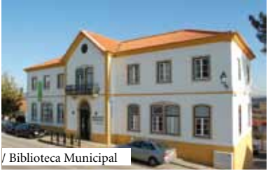
/ Biblioteca Municipal