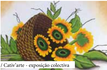
/ Cativ'arte - exposição colectiva