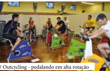
/ Outcycling - pedalando em alta rotação