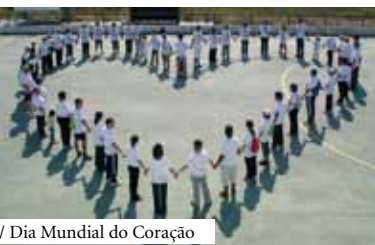
/ Dia Mundial do Coração