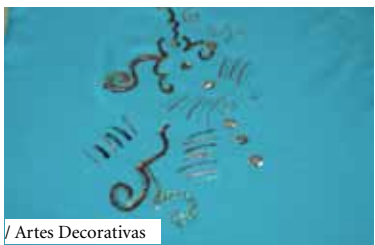
/ Artes Decorativas

Todos os ateliês são gratuitos, sendo sujeitos a inscrição prévia na Biblioteca Municipal.