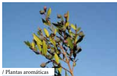
/ Plantas aromáticas