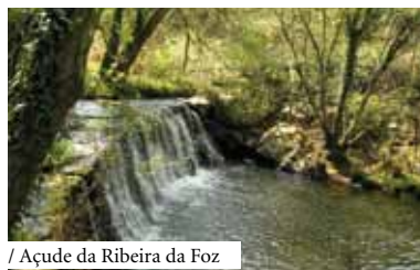
/ Açude da Ribeira da Foz

Percorso pedestre pela Ribeira da Foz, como forma de sensibilização para a importância do património cultural. Este percurso terminará, com um piquenique, na Pereira. Distância: 8 km | Duração média: 4h00 | Dificuldade: Considerável. Público-alvo: a partir dos 10 anos. Actividades com inscrição obrigatória.