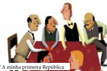
/ A minha primeira República