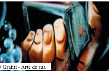
/ Grafiti - Arte de rua