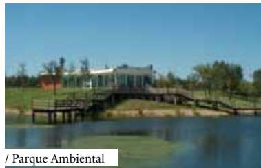
/ Parque Ambiental