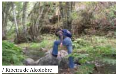
/ Ribeira de Alcolobre